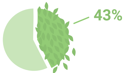
Pošumljenost u EU